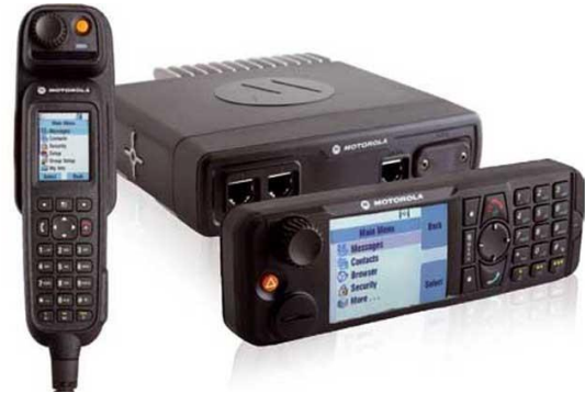
MTM800FuG inkl. Bedienhandapparat & Bedienteil [MRT/FRT]