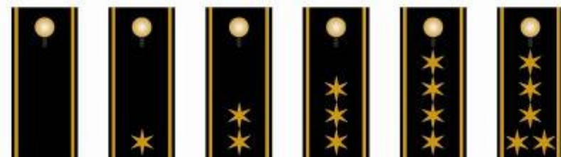
Brandreferendar Brand (A12) Oberbrand (A14) Brandchef (A15) Lfd. Brandchef (A16) Stabschef (A17)