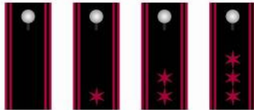
Feuerwehrmann in Probezeit Feuerwehrmann Oberfeuerwehrmann Hauptfeuerwehrmann