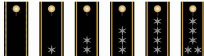
Brandinspektör- Anwärter Brandinspektör (A6) Brandoberinspektör (A13) Brandmeister (A11) Brandchef (A12) Brandbrandant (A13)