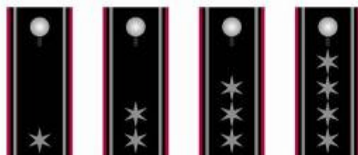
Brandmeister Oberbrandmeister Hauptbrandmeister Lehender Hauptbrandmeister