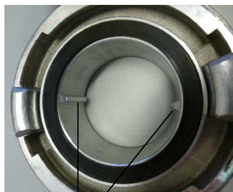
Bild 3 Innenliegender Gewindestutzen mit Stegen für Spezialwerkzeug

Das drehbar gelagerte Knaggenteil ist über einen innenliegenden Gewindestutzen mit dem Gehäuse verschraubt. Um diesen innenliegenden Gewindestutzen festzuschrauben oder zu lösen ist ein Spezialwerkzeug erforderlich, das an der Innenseite des Gewindestutzens die zwei Stege ( Bild 3 ) greift.