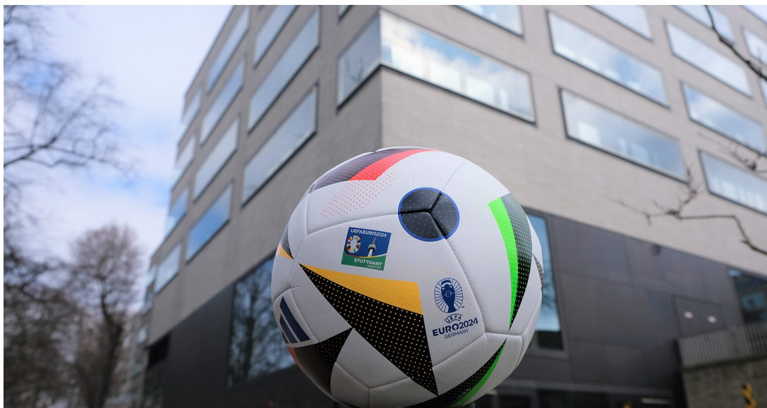
UEFA Euro 2024

Das Ministerium des Inneren, für Digitalisierung und Kommunen sieht Baden-Württemberg gut auf die UEFA Euro 2024 vorbereitet.